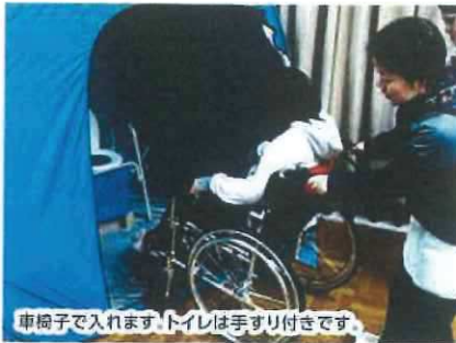
車椅子で入れます。トイレは手すり付きです。

プライバシー保護／ご家族単位で／お母さんと幼児／ 体の不自由な人のために／着替えルームとして／トイレとして