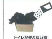
トイレが使えない時