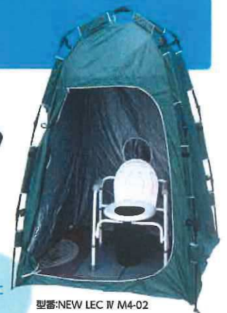
型番:NEW LEC IV M4-02