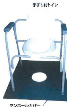
マンホールガイド