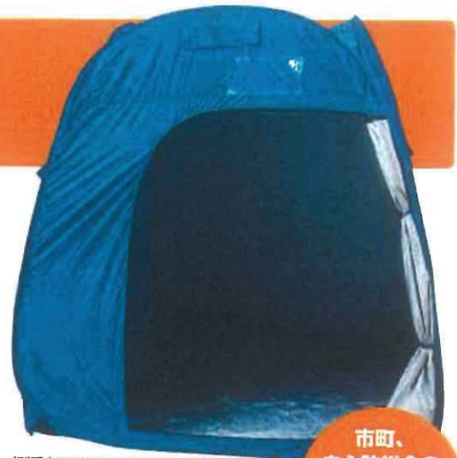
(型番:NEW LEC KIZUNA 4-01)